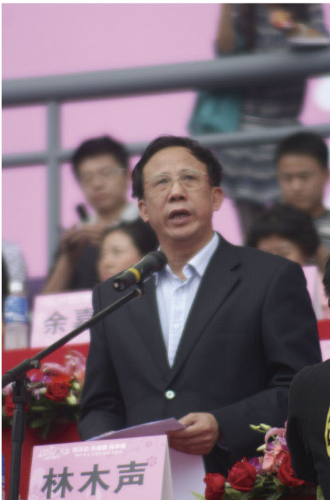
省政府副省长林木声出席活动并作重要讲话

为纪念国际劳动妇女节101周年，3月6日下午，由省妇联与正大卜蜂莲花主办，省妇女儿童基金会承办的“我运动·我健康·我幸福”大型公益活动在广州大学城中心体育场隆重举行，原省人大主任、基金会理事长张帼英，省政府副省长林木声，省政协副主席、省妇联主席温兰子等领导出席活动，各界妇女代表10000多人共同参与。现场捐赠人民币及实物折款共1550万元。