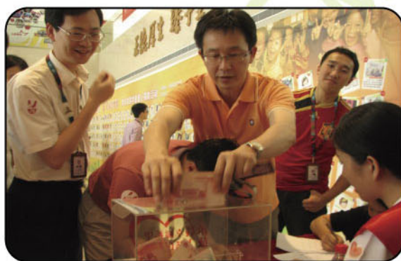
中国移动广东公司爱心人士积极为贫困儿童献爱心