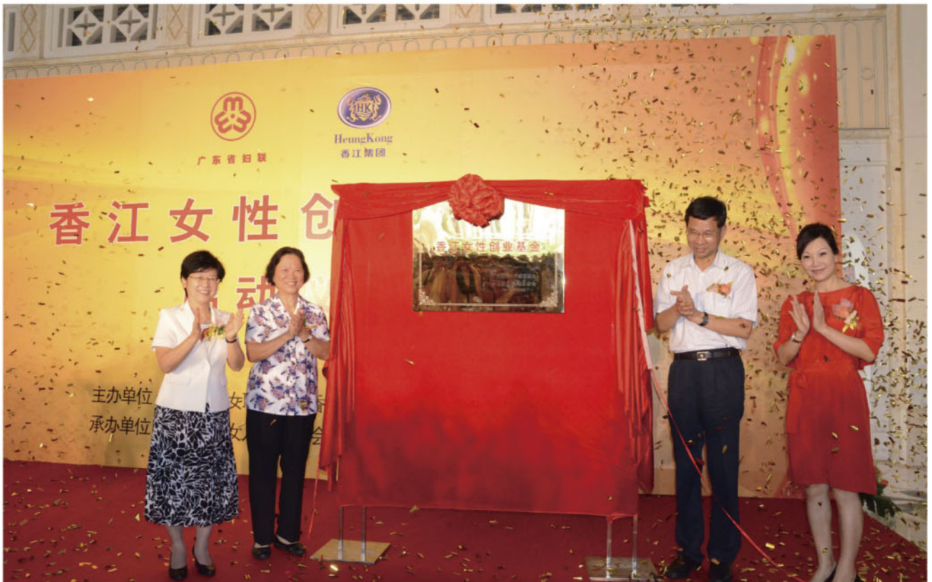
省人大常委会原主任、基金会理事长张帼英（左二），省政府副省长刘昆（右二），省政协副主席、省妇联主席温兰子（左一）、香江集团总裁翟美卿（右一）共同为“香江女性创业基金”揭幕