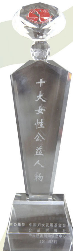
香江集团翟美卿荣获“十大女性 公益人物”奖项