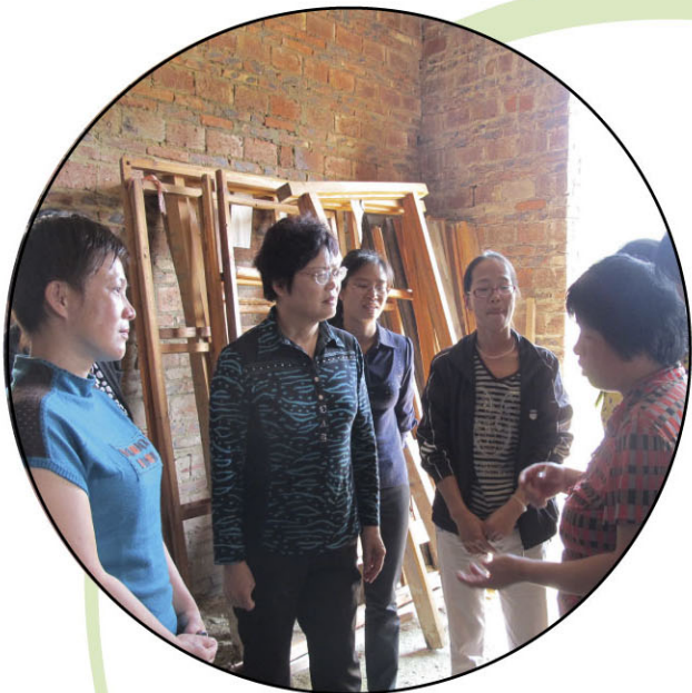
省妇联副巡视员张丽玲（左二）到茂名市检查单亲母亲安居房援建工作

此外，基金会还对检查中发现的问题集中反馈给各市妇联，要求尽快整改完善。此次检查进一步推动了“四援助”工作向规范化、制度化发展。