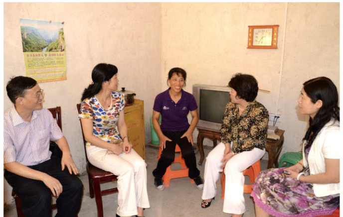
各市妇联代表入户探望和慰问韶关市“单亲特困母亲”家庭