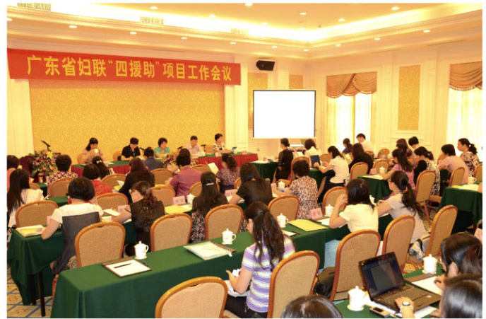
“四援助”项目工作会议现场