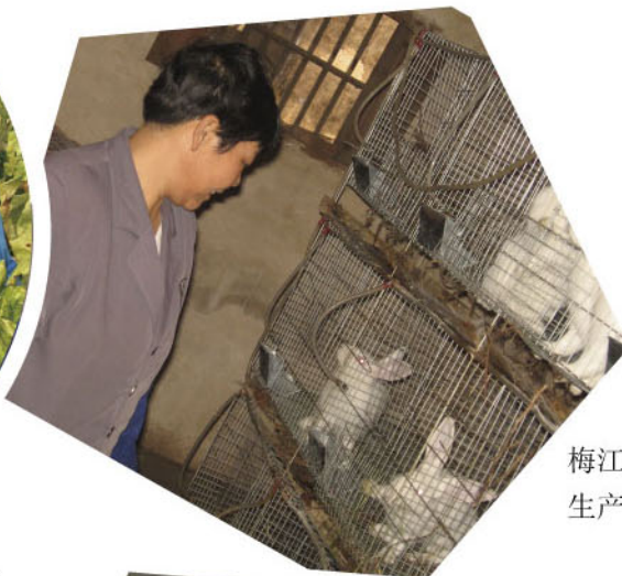
梅江区受助贫困母亲利用 生产资金发展养兔业