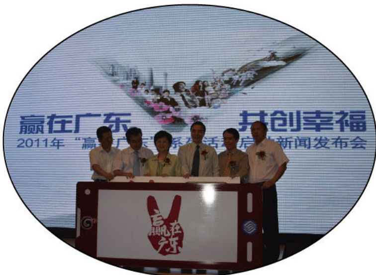
省政协副主席、省妇联主席温兰子(左三)，中国移动广东公司总经理徐龙(右三)出席“139说客数字化爱心帮扶”启动仪式

为全面贯彻落实省委省政府关于“加快转型升级，建设幸福广东”的精神，广东移动联合省妇联、基金会等部门共同启动了“139说客数字化爱心帮扶”行动。139爱心公益平台是为受助者和捐赠者搭建的一个数字化桥梁和纽带，是帮扶助困模式的一种创新。通过139爱心公益平台，让更多的人关心、关注他们，让爱心人士通过平台可以随时了解救助人的情况，并与其产生互动，及时给予帮助。