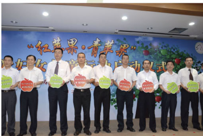
中国人寿广东省分公司及下属子公司积极参与爱心捐助