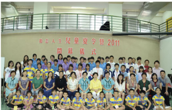
2011年“温暖行动—励志人生”夏令营活动在香港举行

“温暖行动—励志人生夏令营”活动是省妇女儿童基金会与香港女童军总会联合开展帮扶孤贫儿童的活动之一，让从未走出大山、走出乡村的孤贫学生代表来到香港，迈开励志人生香港之旅。每一期的“励志人生夏令营”活动，都为孤贫学生的生活、学习带来可喜的变化，让他们感受到社会大家庭的关爱和温暖，为他们树立了人生新的目标。2011年8月19日至23日，一年一次的“温暖行动—励志人生”夏令营活动如期在香港举行，来自韶关、梅州两市31名孤贫儿童参加了此次夏令营活动。