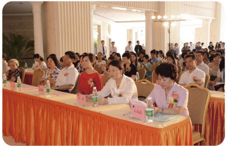
“香江女性创业基金”启动仪式现场