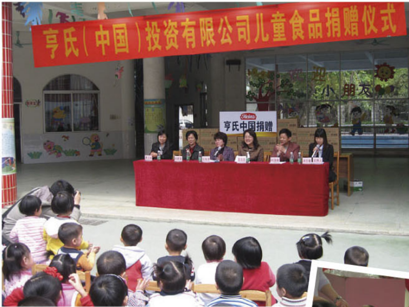
亨氏(中国)投资有限公司在 清远市捐赠儿童食品现场

省妇联、省妇女儿童基金会积极为爱心企业、爱心人士搭建公益平台帮助企业为儿童献爱心做善事，近年来亨氏（中国）投资有限公司持续开展关爱困境儿童活动，2011年再次捐赠价值50万元的欧洲原装进口儿童食品，为清远地区732名生活困难的儿童送去关爱，把温暖带给福利院的孩子和困境儿童。