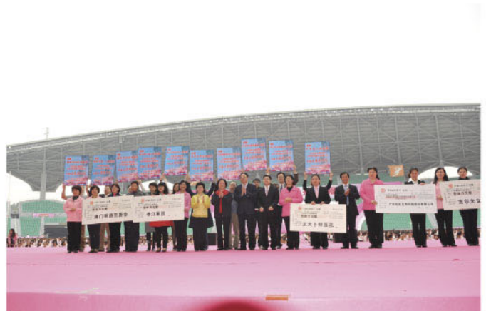
活动现场捐款及实物折算1500万元