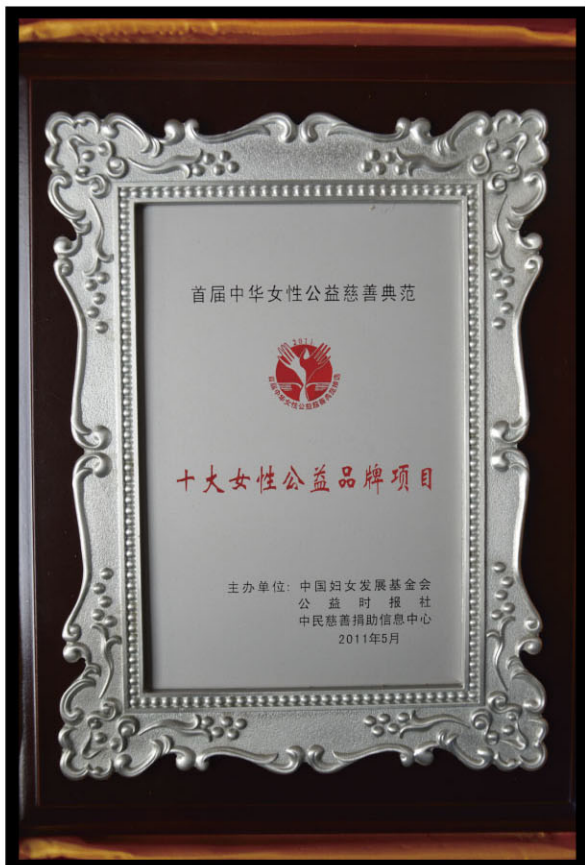
“广东单亲特困母亲四援助项目”获 “十大女性公益品牌项目”奖项

2011年5月7日，由中国妇女发展基金会、中国民间慈善捐助信息中心、公益时报主办的“首届中华女性公益慈善典范”评选活动在江苏省淮安市举行。“广东单亲特困母亲四援助项目”、香江集团翟美卿分获“十大女性公益品牌项目”和“十大女性公益人物”奖项。