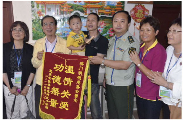
患儿家长赠送锦旗，感谢澳门明德慈善会的帮助