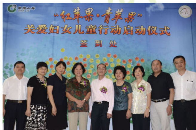
出席仪式的领导、嘉宾在捐款签字牌前合影