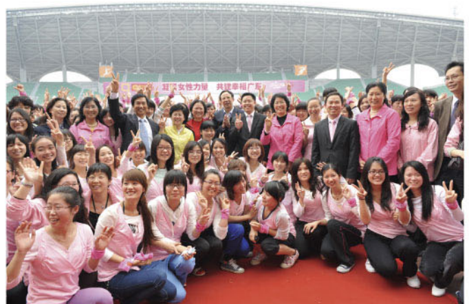
领导嘉宾与学生一起开心留影