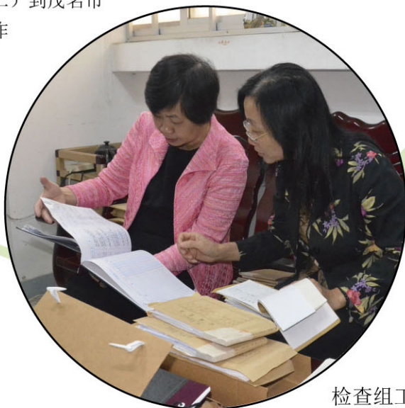
检查组工作人员认真检查台账情况