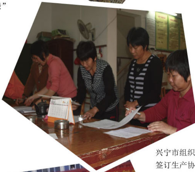
兴宁市组织受助贫困母亲 签订生产协议书