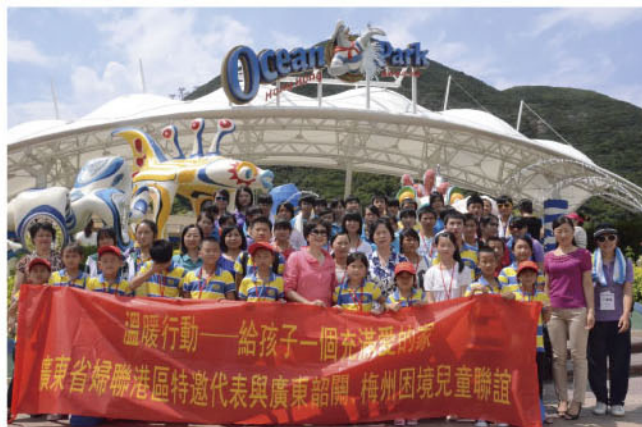
参加夏令营活动的孩子们在香港海洋公园开心合影