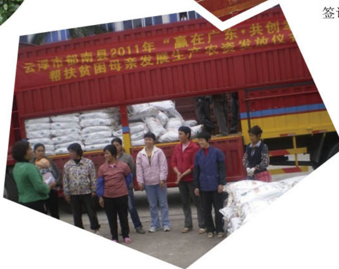
郁南县50多位受助贫困母亲每人获得1吨化肥