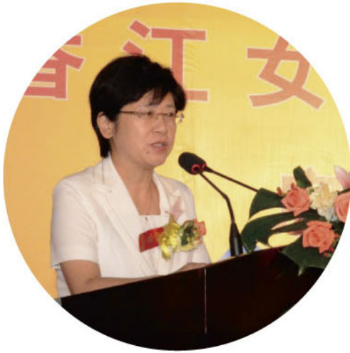
省政协副主席、省妇联主席温兰子在“香江女性创业基金”启动仪式上讲话

香江集团总裁翟美卿女士于2011年捐款1000万元，在省妇女儿童基金会设立了“香江女性创业基金”，以金融扶贫的方式，帮扶农村贫困妇女创业提供小额担保贷款贴息，扶持有发展条件的农村贫困妇女增收致富。