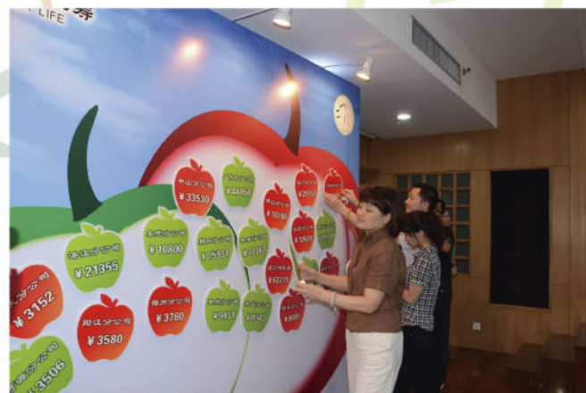
中国人寿广东省分公司各子公司代表在“红苹果·青苹果”牌前认捐