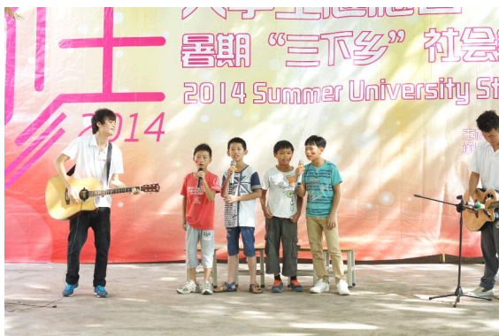
志愿者和孩子们同台演绎。