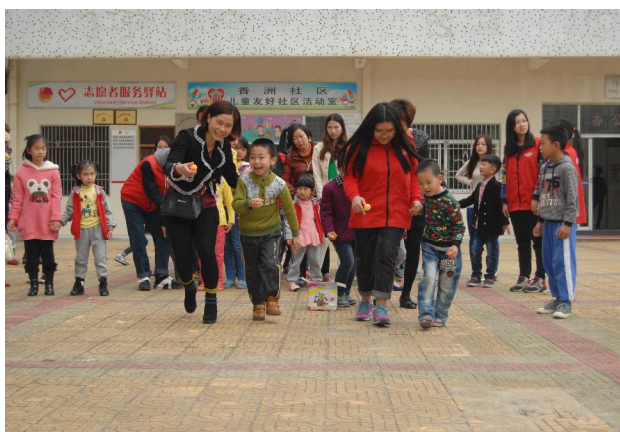
汕尾市香洲儿童友好社区开展“伴你一起成长”亲子活动。