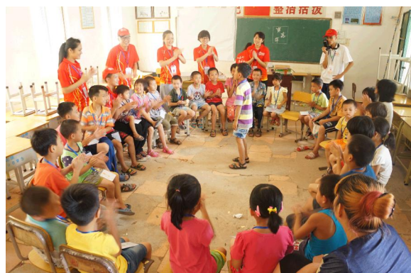
孩子们在课堂上表演文艺节目。