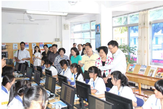
清远市佛冈县“电子书阅览室”投入使用。

2014 年，基金会与广州岭南教育集团有限公司合作，筹资 200 万元，资助广东岭南职业技术学院 2014 级“百万励志工程”，专项支持贫困大学生入读岭南、向紫金县蓝塘镇石城小学捐建“岭南书屋”、资助清远市佛冈县“电子书阅览室”建设；资助岭南学院 5 支团队开展 2014 年暑期大学生“三下乡”活动、在暑期开展河源市紫金县乡村小学骨干教师培训活动。