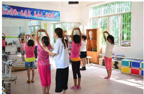
志愿者手把手教孩子们学习舞蹈。