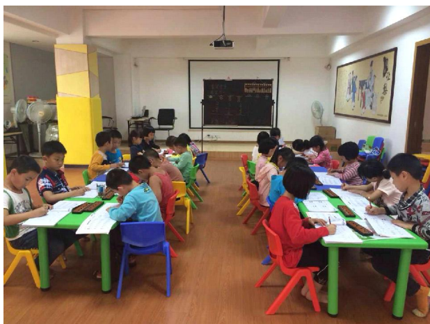
梅州市大埔县城北爱心图书室开展珠心算兴趣班。