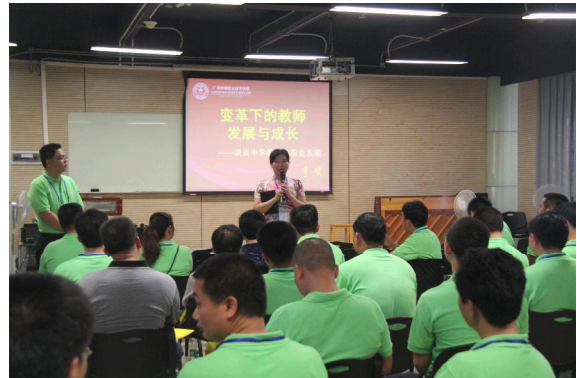
组织河源市紫金县乡村小学教师进行骨干教师培训。