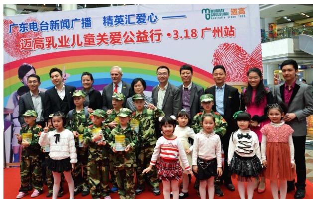
迈高乳业（青岛）有限公司通过省妇女儿童基金会向经济欠发达地市福利院、贫困家庭幼儿及社会散居孤儿捐赠 5000 罐配方奶粉，价值 119.5 万元。