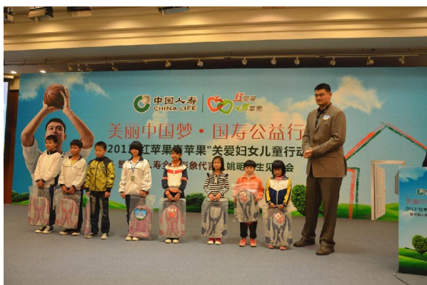
中国人寿形象代言人姚明与受助孤儿代表合影并捐款 10 万元援助孤贫儿童项目。