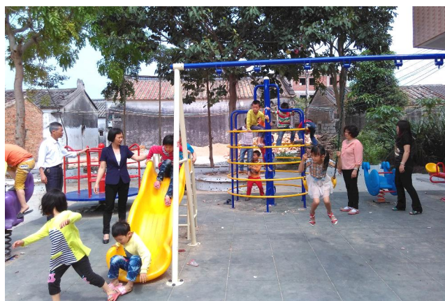
孩子们在普宁市云落镇新星村儿童友好社区开心地玩耍。