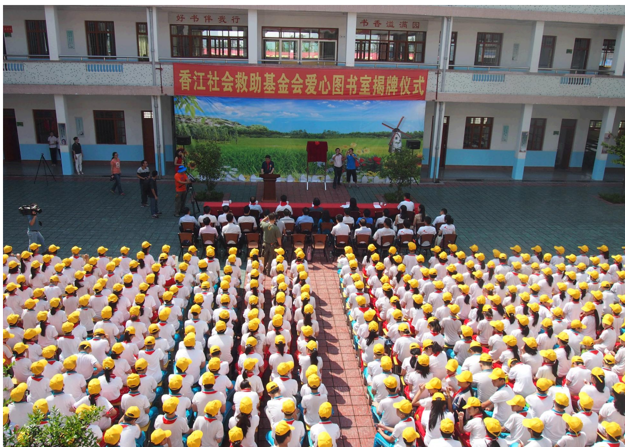
香江社会救助基金会爱心图书室在丰顺县汤西镇中心小学举行揭牌仪式。