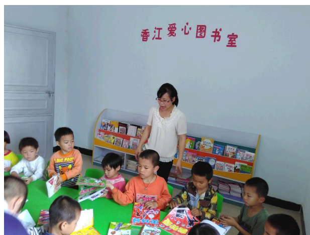
普宁市云落镇新星村爱心图书室里老师正在指导儿童阅读。