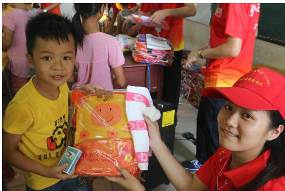
志愿者送书包等学习、生活用品给留守儿童们。