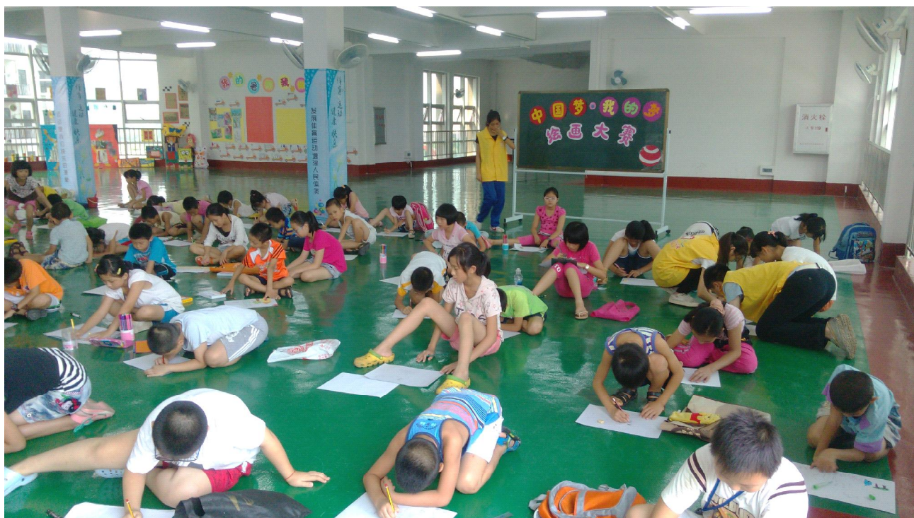
江门市银泉儿童友好社区开展“中国梦--我的梦”绘画大赛，孩子们踊跃参与。

2014年，省妇联、省妇女儿童基金会与香江社会救助基金会合作，共筹资550万元，其中430万元用于创建50个儿童友好社区，受益人口约30万，为儿童及其家庭提供游戏、娱乐、教育、社会心理支持，提高家长、临时监护人家庭教育的能力，改善亲子关系，促进儿童健康成长；120万元用于援建爱心图书室99个，给经济欠发达地区的孩子们带来知识、带来快乐、带来梦想、带来力量，帮助他们更好地成长成才，实现人生理想。